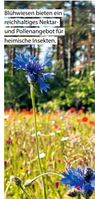
Blühwiesen bieten ein reichhaltiges Nektar- und Pollenangebot für heimische Insekten.