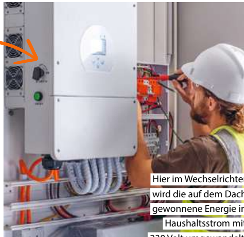
Hier im Wechselrichter wird die auf dem Dach gewonnene Energie in Haushaltsstrom mit 230 Volt umgewandelt.