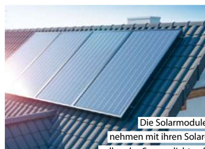
Die Solarmodule nehmen mit ihren Solarzellen das Sonnenlicht auf.