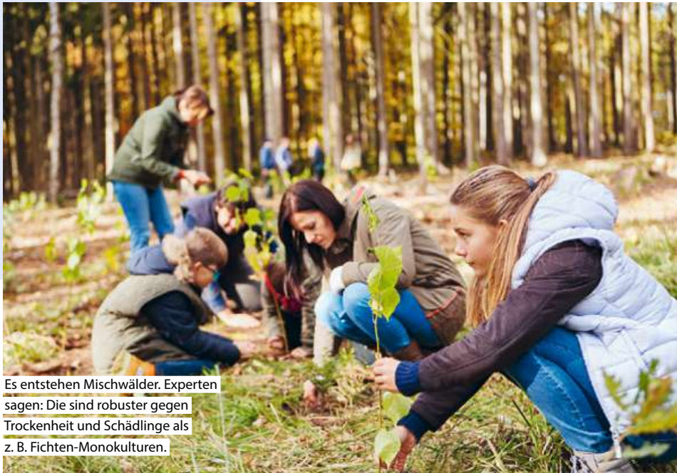
Es entstehen Mischwälder. Experten sagen: Die sind robuster gegen Trockenheit und Schädlinge als z. B. Fichten-Monokulturen.