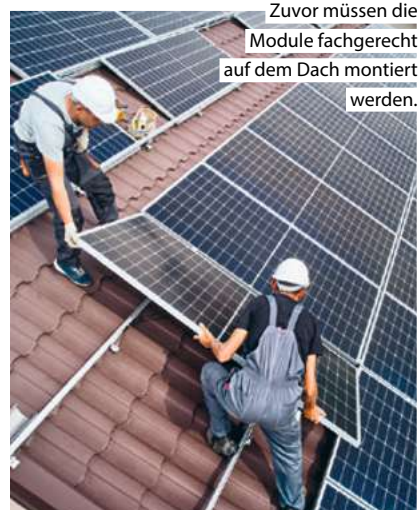
Zuvor müssen die Module fachgerecht auf dem Dach montiert werden.

Wir unterstützen Sie bei der finanziellen Umsetzung Ihres Vorhabens. Mehr unter www.sparda-h.de/nachhaltig-modernisieren ☎ 0511 3018-0